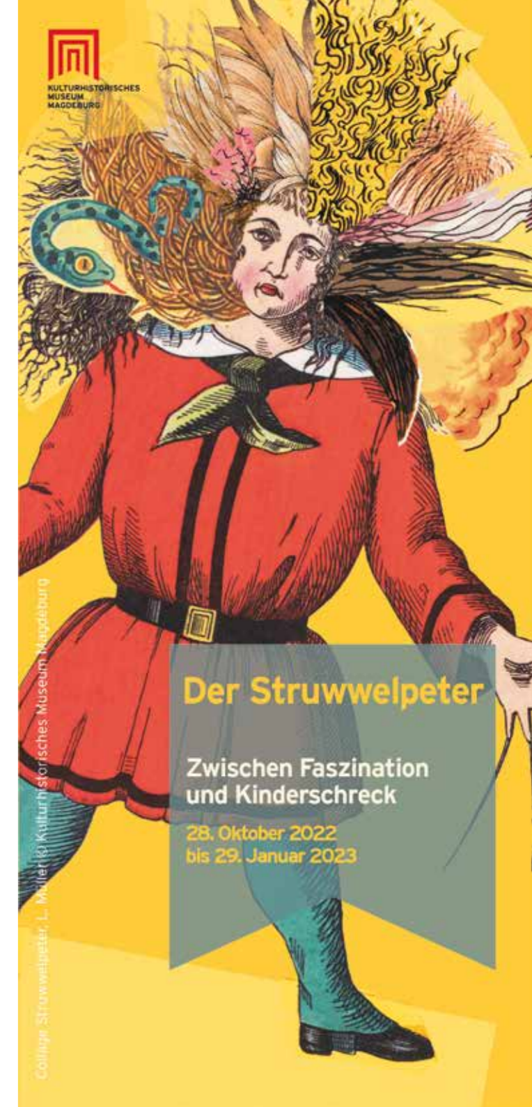
Collage: Struwwelpeter, L. Meißler

Reformationstag am 31. Oktober - geöffnet Heiligabend und erster Weihnachtsfeiertag - geschlossen zweiter Weihnachtsfeiertag - geöffnet Silvester - geschlossen