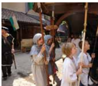
In der Spielstadt Megedeborch