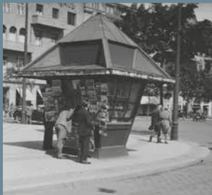
von links nach rechts: Zeitungskiosk, nach Entwurf von Bruno Taut, 1922 Siedlung »Neue Heimat« in Magdeburg Süd-Ost, 1928 Ausstellungsgelände mit Albinmüller-Turm, Leuchtstele und Stadthalle, Postkarte um 1928